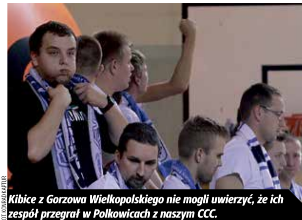
Kibice z Gorzowa Wielkopolskiego nie mogli uwierzyć, że ich zespół przegrał w Polkowicach z naszym CCC.