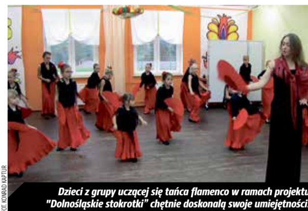
Dzieci z grupy uczącej się tańca flamenco w ramach projektu „Dolnośląskie stokrotki” chętnie doskonaliły swoje umiejętności.