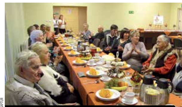
W trakcie spotkania z okazji Dnia Seniora w świetlicy wiejskiej w Guzicach atmosfera była niemal rodzinna.