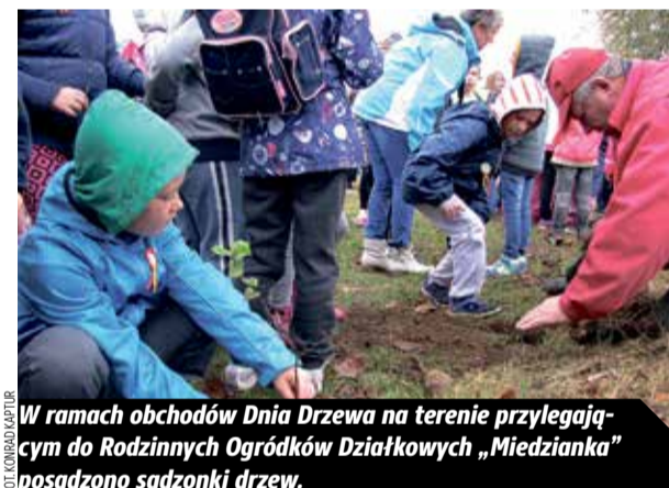
W ramach obchodów Dnia Drzewa na terenie przylegającym do Rodzinnych Ogródków Działkowych „Miedzianka” posadzono sadzonki drzew.