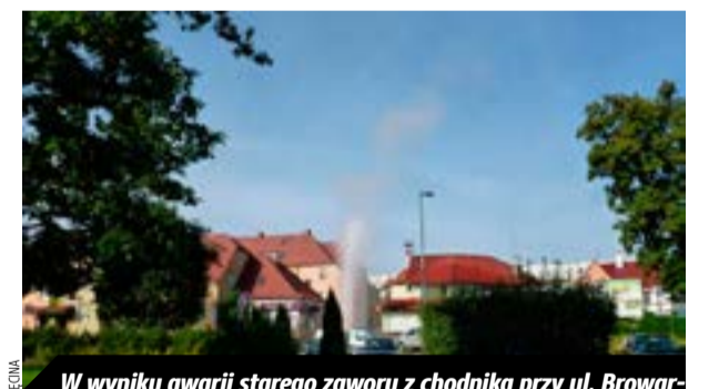
W wyniku awarii starego zaworu z chodnika przy ul. Browarnej trysnął gejzer wody. Efektowny pokaz zakończyli pracownicy PGM, usuwając awarię.