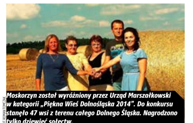
Maskorzyn został wyróżniony przez Urząd Marszałkowski w kategorii „Piękna Wieś Dolnośląska 2014”. Do konkursu stanęło 47 wsi z terenu całego Dolnego Śląska. Nagrodzono tylko dziewięć sołectw.

ZADZWOŃ, CZEKAMY NA TWOJĄ OPINIĘ GAZETA POLKOWICKA TEL. 76 724-97-20