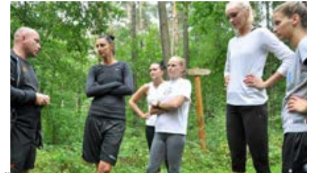
11 sierpnia koszykarki CCC Polkowice rozpoczęły przygotowania do nowego sezonu. Pierwszy trening odbył się na ścieżce zdrowia.