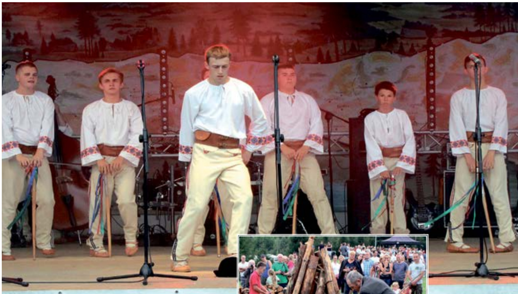
Wspaniałe koncerty to jeden z wielu magnesów przyciągających rokrocznie na Watrę.

W piątek (1.08) na polanę w Michałowie tradycyjnie zjechały setki Łemków z różnych zakątków świata. Okazją ku temu była tradycyjna Watra na Obczyźnie. Przez dwa dni odbyło się mnóstwo ciekawych koncertów, turniejów i zabaw.