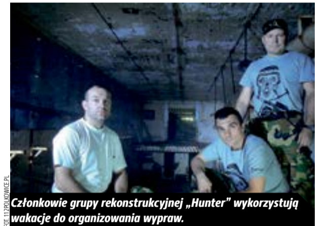
Członkowie grupy rekonstrukcyjnej „Hunter” wykorzystują wakacje do organizowania wypraw.