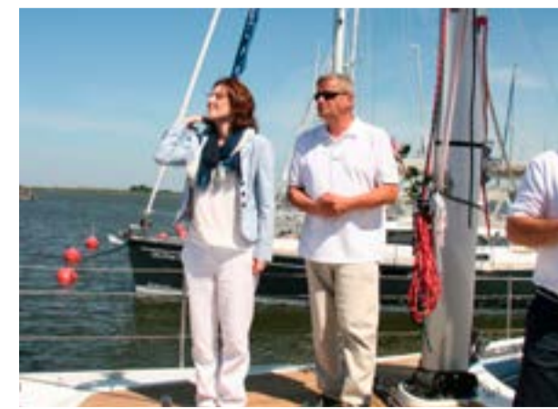
Jacht typu Delphia wyposażono w najnowsze urządzenia nawigacyjne