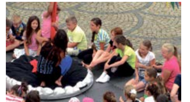
Trwają zajęcia wakacyjne organizowane przez Polkowickie Centrum Animacji. Dzieci mogą liczyć na szereg atrakcji, między innymi zajęcia akrobatyczne.